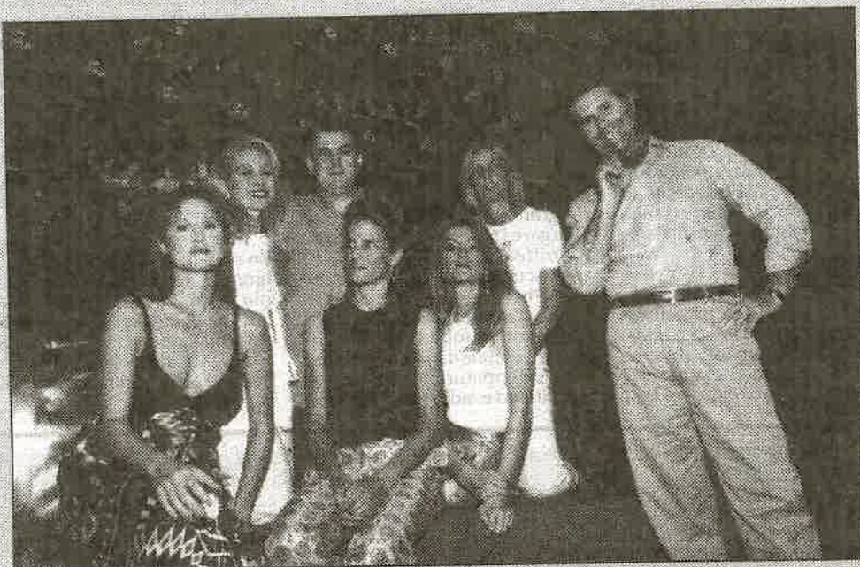
Gli attori con il sangue blu in scena al teatro Olimpico

In trenta al teatro Olimpico protagonisti di una pièce per beneficenza